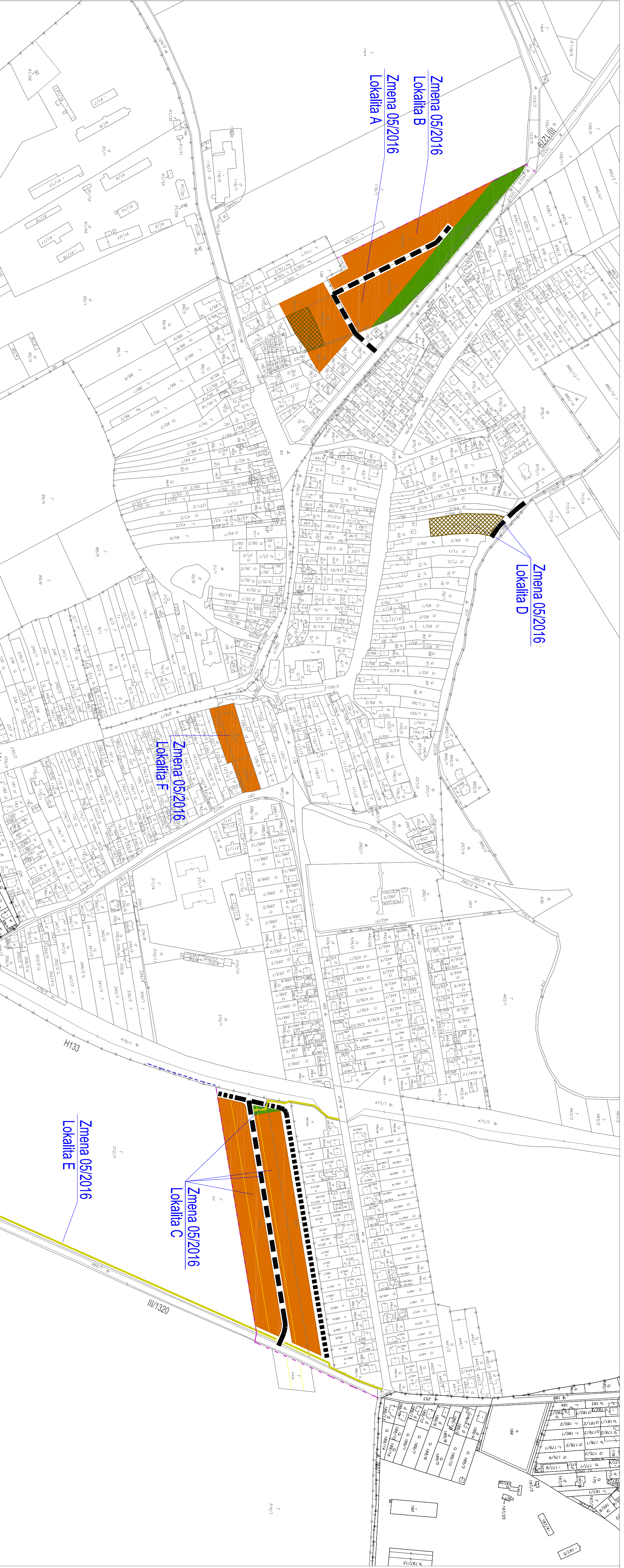
Uzemný plán obce Šurince Zmena 05/2016