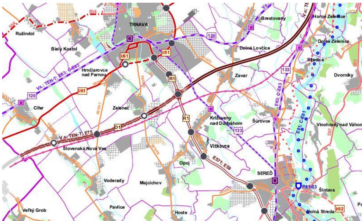
Mapa 1 Dopravné vzťahy