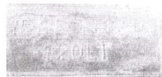
Zvyčajná napodobenina označenia normy (tu konkrétna razba na nádobe zn. GAMA)

Na základe vyhodnotenia reklamácií, ktoré obce u nás uplatňujú z dôvodu poškodenia nádob pri zvoze, možno konštatovať, že až v 90% prípadoch sa jedná o poškodenia, ktoré vznikli z dôvodu, že materiál, z ktorého bola nádoba vyrobená je nižšej kvality a nie je totožný s materiálom, z ktorého sú vyrobené nádoby spĺňajúce EN 840-1. Spravidla sa jedná sa o nádoby, ktoré sú predávané, ako tzv. hobby výrobky pre dom a záhradu. V ostatných prípadoch sa jedná o poškodenia, ktoré vznikli, v rovnakom podiele, nesprávnym používaním nájomcom nádoby (najmä preťaženie nádoby, neprimerané zhutnenie odpadu zabraňujúce jeho výsypu, oslabenie a následné poškodenie steny nádoby následkom ukladania popola) a chybou našich pracovníkov pri výsype (spravidla zalisovanie nádoby) a to pri oboch typoch nádob.