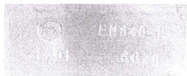
V súlade s EN 840-1 na 120L nádobe